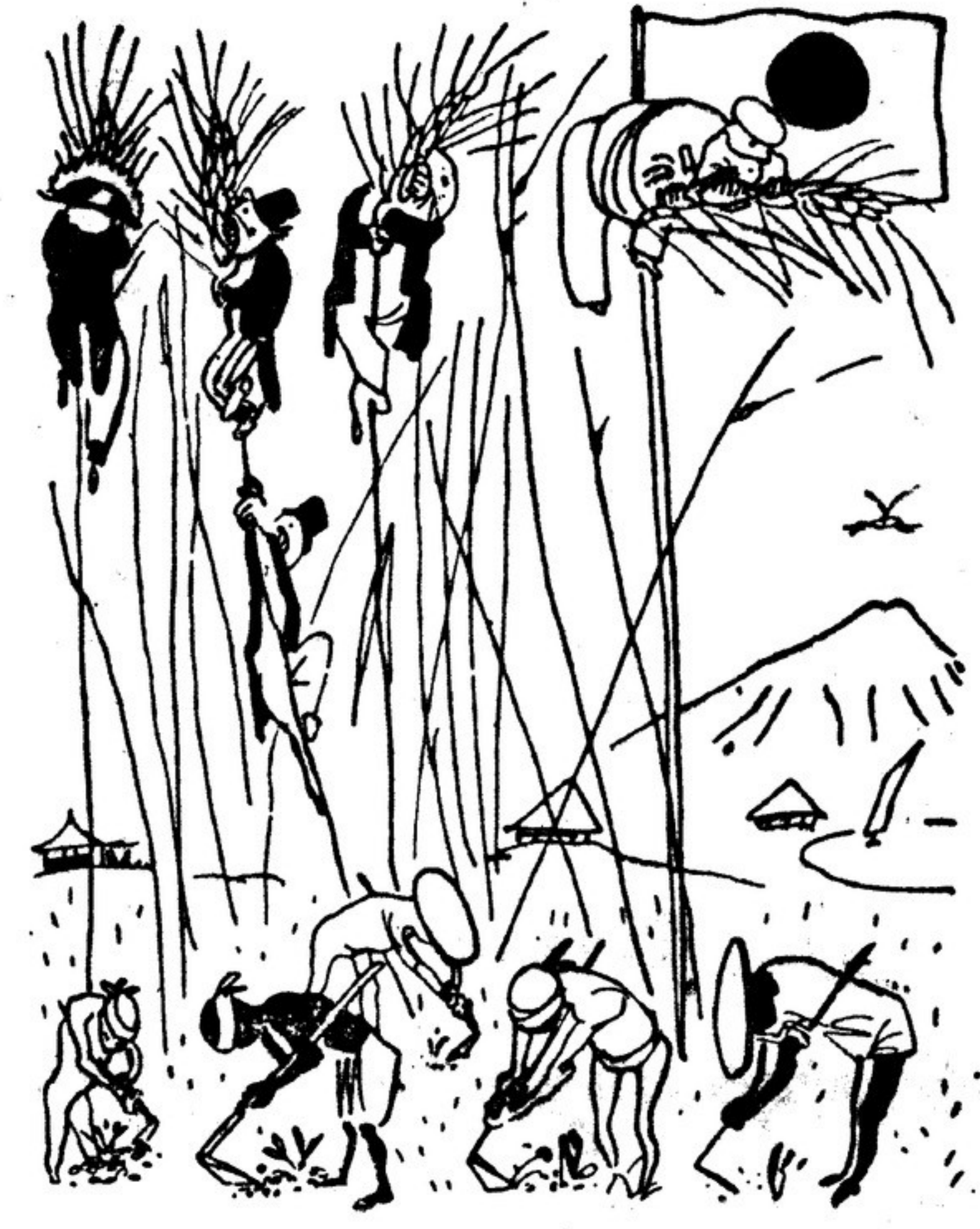
«Японский пейзаж» - рисунок худ. А. Каневского из первой книги альманаха «Молодость» (Молодая Гвардия).