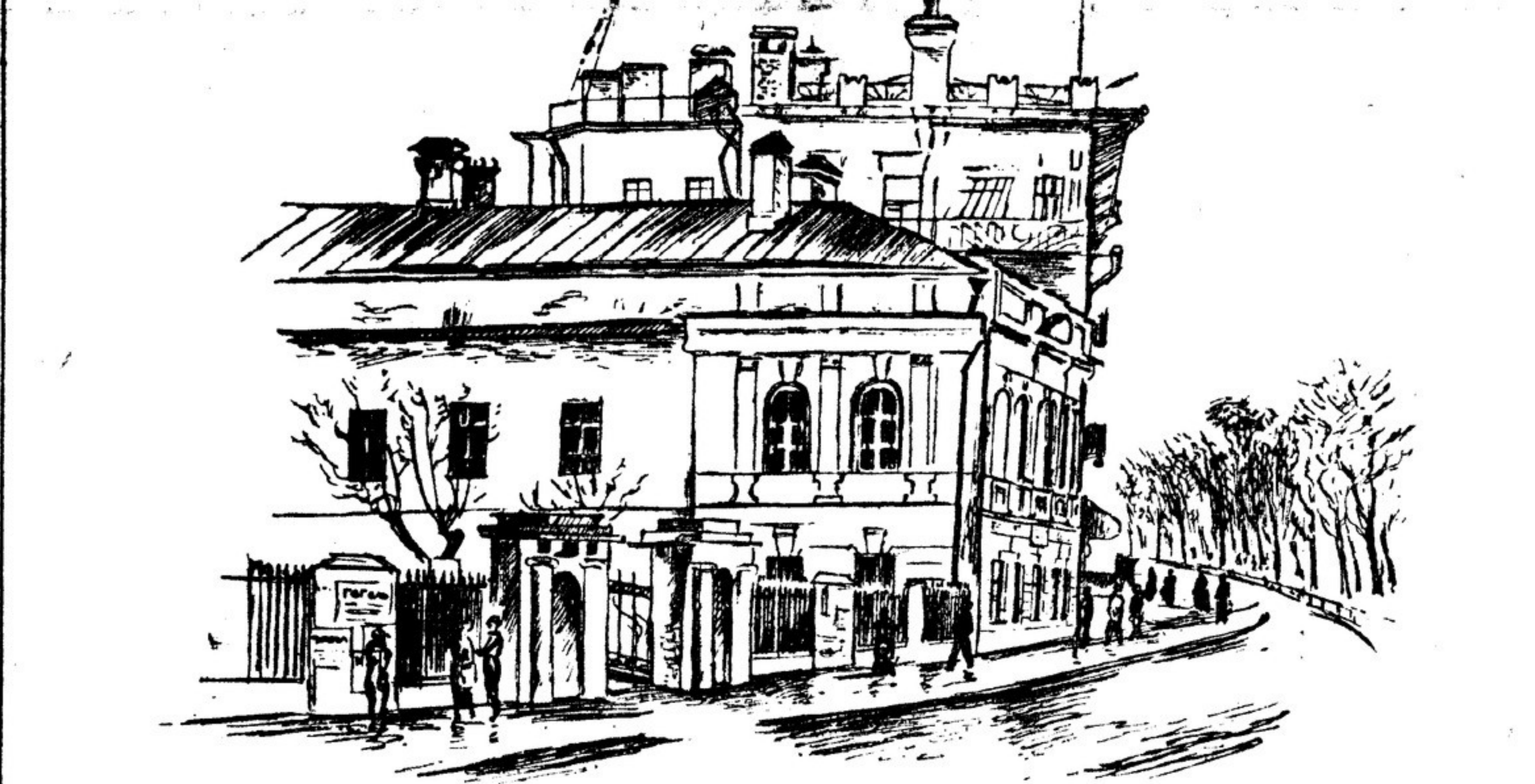
Дом № 7-а по Никитскому бульвару, в котором жил и умер Н. В. Гоголь (очерк об этом см. на 4-й стр.)